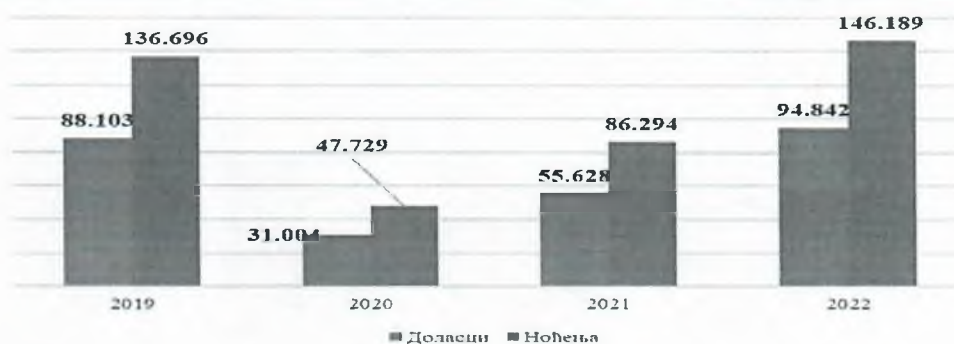
Граф 4. Број долазака и ноћења домаћих и страних туриста на подручју града Бањалука

Страни гости из Србије (31,1%), Словеније (18,6%) те Хрватске (10,3%) током 2022. године највише су посјећивали Бањалуку и чинили су 60% укупних долазака страних туриста.