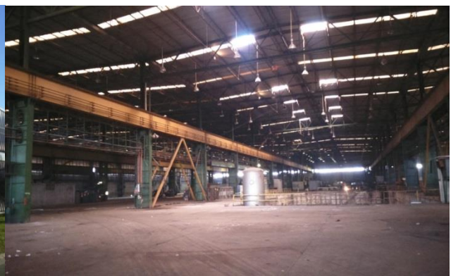
Позиција хале унутар пословне зоне и вањски и унутрашњи изгледи производне хале