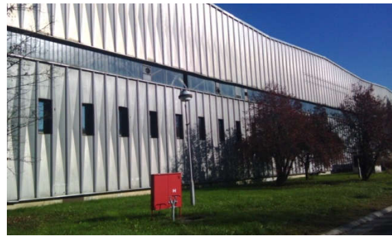
Sl.3 Fotografije unutrašnjeg i spoljnog dijela hale

Procijenjena vrijednost objekta iznosi : 6.965.983,00 KM (procjena vrijednosti iz 2017. godine).