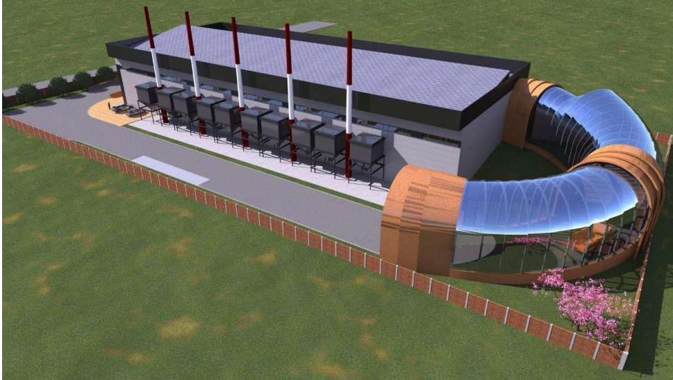
Slika 1: Vanjski izgled planirane toplane na biomasu

EBRD razmatra mogućnost da obezbijedi kredit od 8,25 miliona eura Gradu, od čega će Grad uložiti 7,5 miliona eura kao dio svog manjinskog vlasničkog udjela u Kompaniji, a 0,75 miliona eura će biti uloženo kao obrtni kapital za početnu kupovinu biomase.